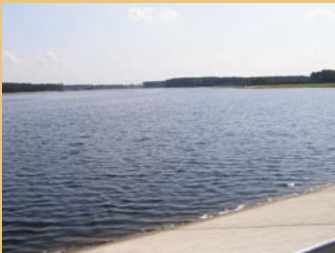
Zbiornik w Murowańcu.