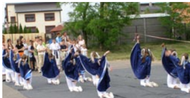
Słoneczka w swoim przebojowym pokazie