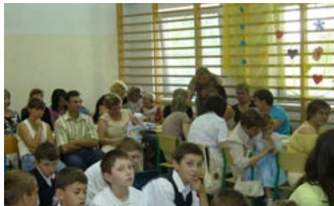
Dzień matki w Nowym Nakwasinie.