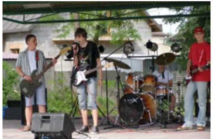
Zespół Electric Clown podczas wspaniałego minikoncertu