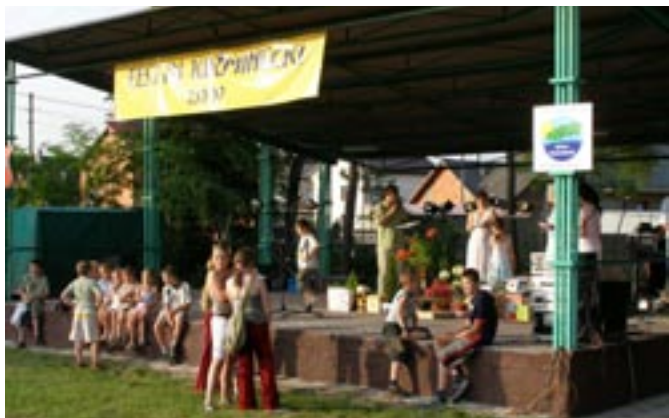
Losowanie nagród głównych w loterii.