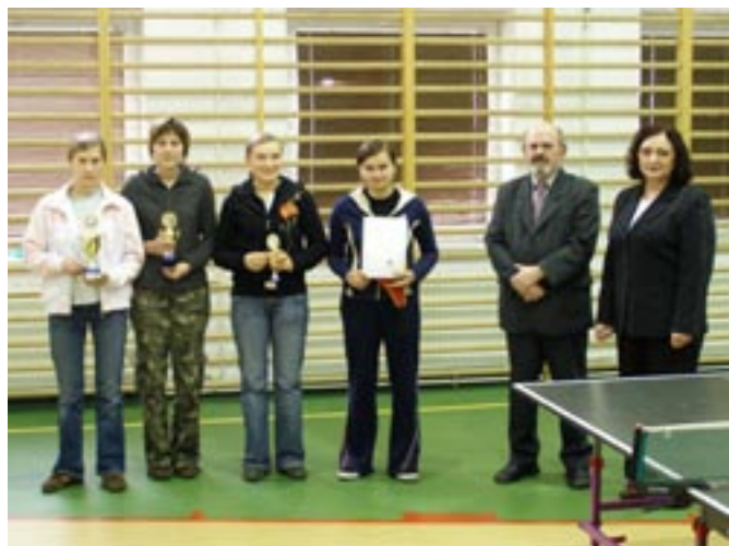
Turniej Tenisa Stołowego w Nowym Nakwasinie.