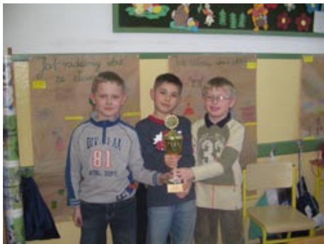
Mali matematycy w Morawinie.