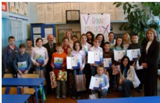
Konkurs angielski w Szkołach Podstawowych.