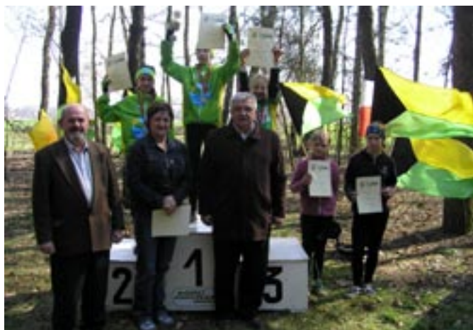
Wyścig kolarski MTB w Koźminku.