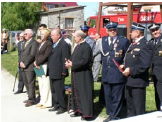
Święto Strażaka w Starym Karolewie.