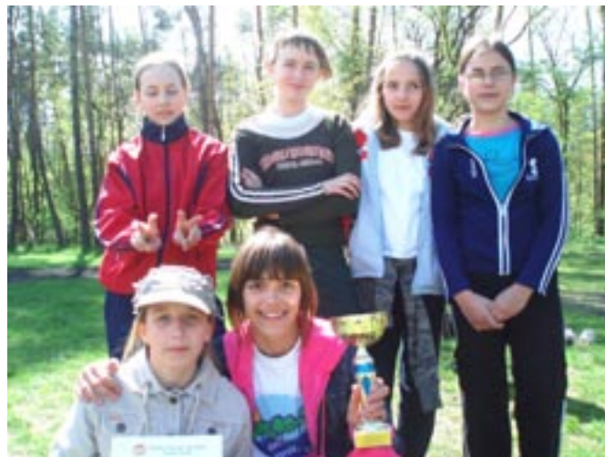
Wysportowane dziewczęta z SP w Koźminku.