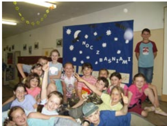
Noc z baśniami.