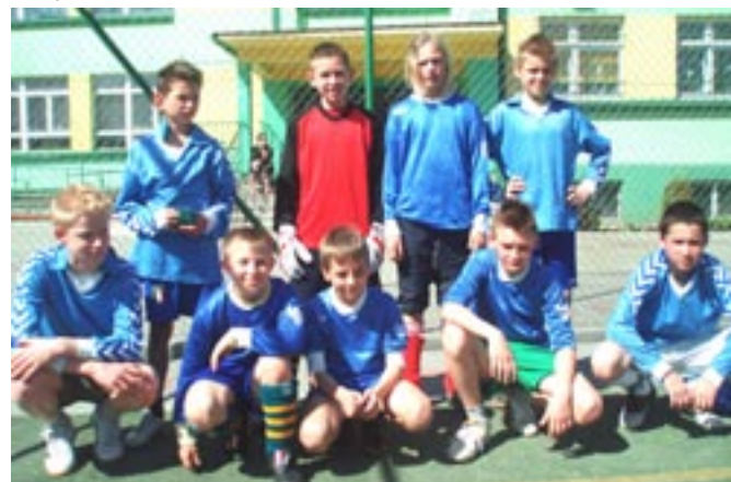
Młodzi sportowcy z SP w Koźminku.