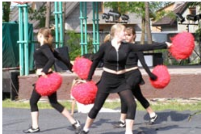
Hexy w układzie tanecznym z pomponami.