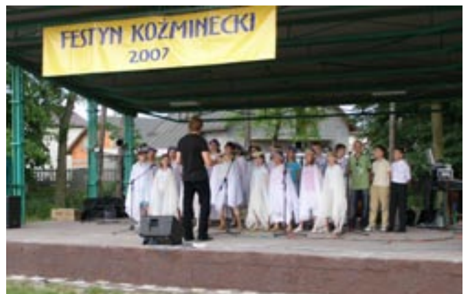
Chór z Moskurni podczas występu na festynie.