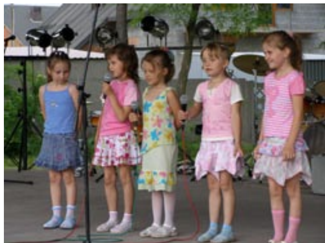
Występ dzieci na festynie