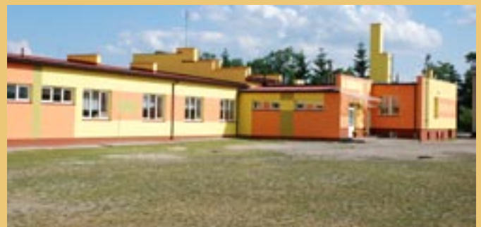
Nowa elewacja SP w Moskurni.