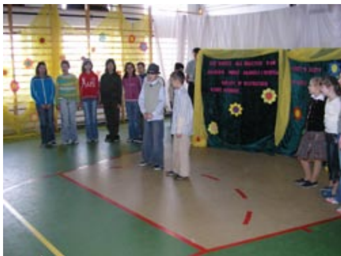
Dzień Kobiet w Nowym Nakwasinie.