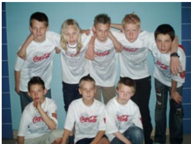
Chłopcy z Koźminka - uczestnicy turnieju Coca Coli.