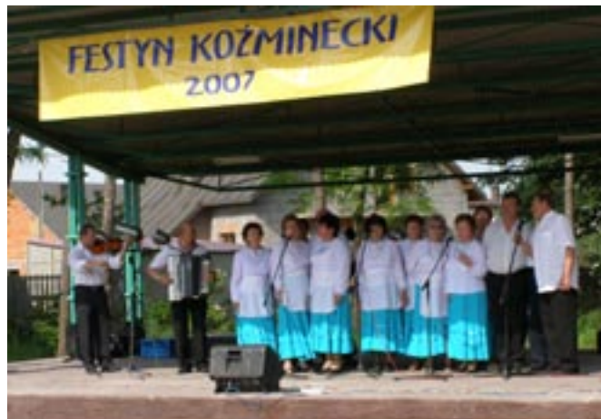
Zespół Koźminianki podczas występu na festynie