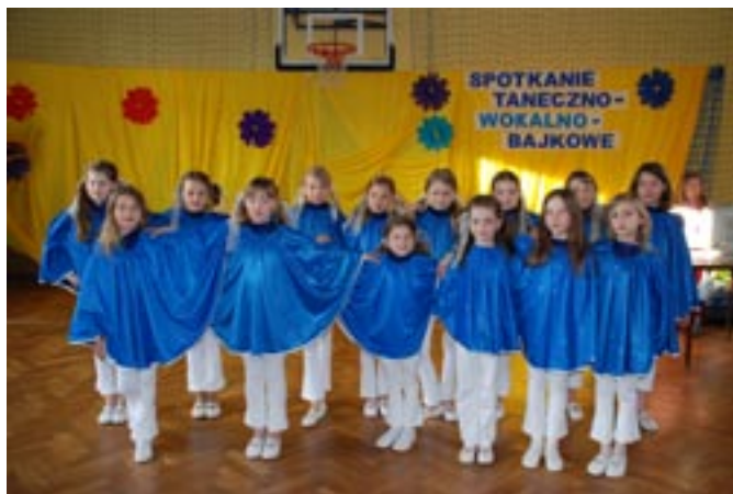
Słoneczka z SP w Koźminku.