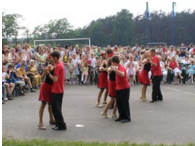
Taneczne popisy uczniów z Nowego Nakwasina