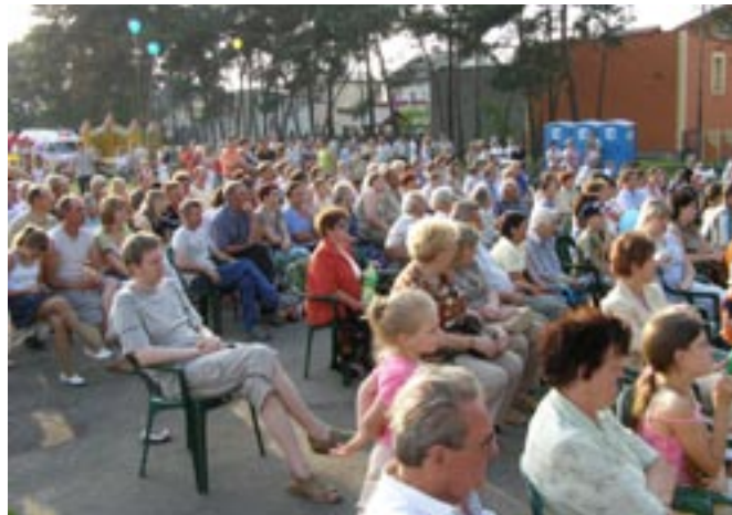
Tłumnie przybyli mieszkańcy i goście na festyn