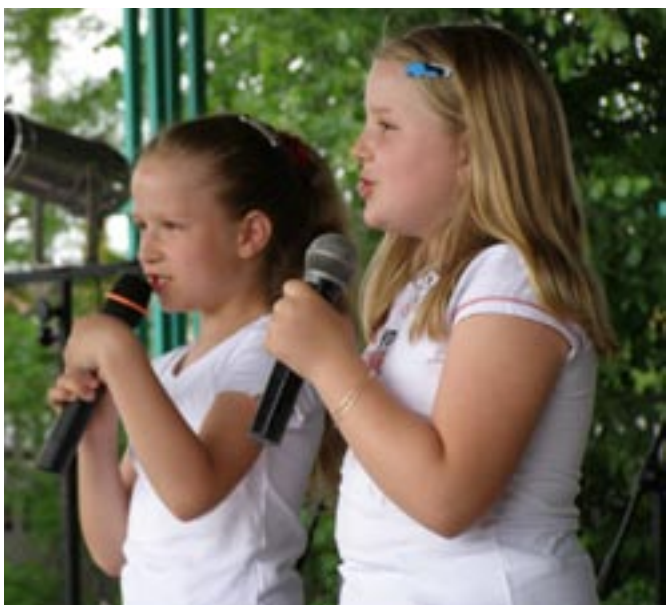
Młode solistki podczas występu na festynie