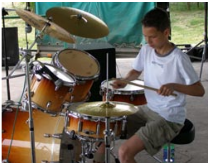
Najmłodszy a zarazem najlepszy perkusista w gminie Koźminek