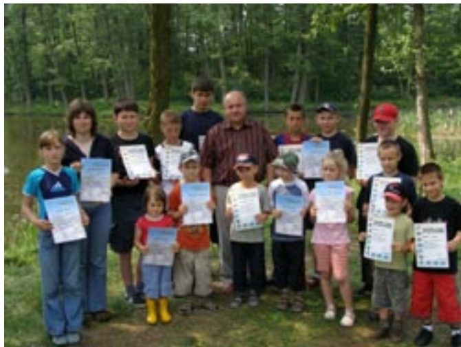
Wójt z laureatami turnieju wędkarskiego

Nad bezpieczeństwem uczestników imprezy czuwała Agencja Ochrony „Cobra” z Kalisza, a patronat medialny sprawowało Radio „Centrum” Kalisz.