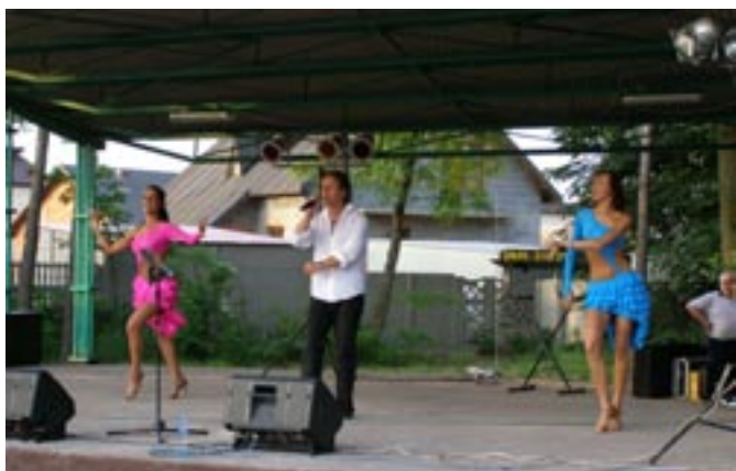
Salsa na Festynie Koźmineckim