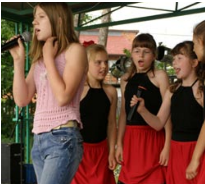
Występ dzieci z Nowego Nakwasina